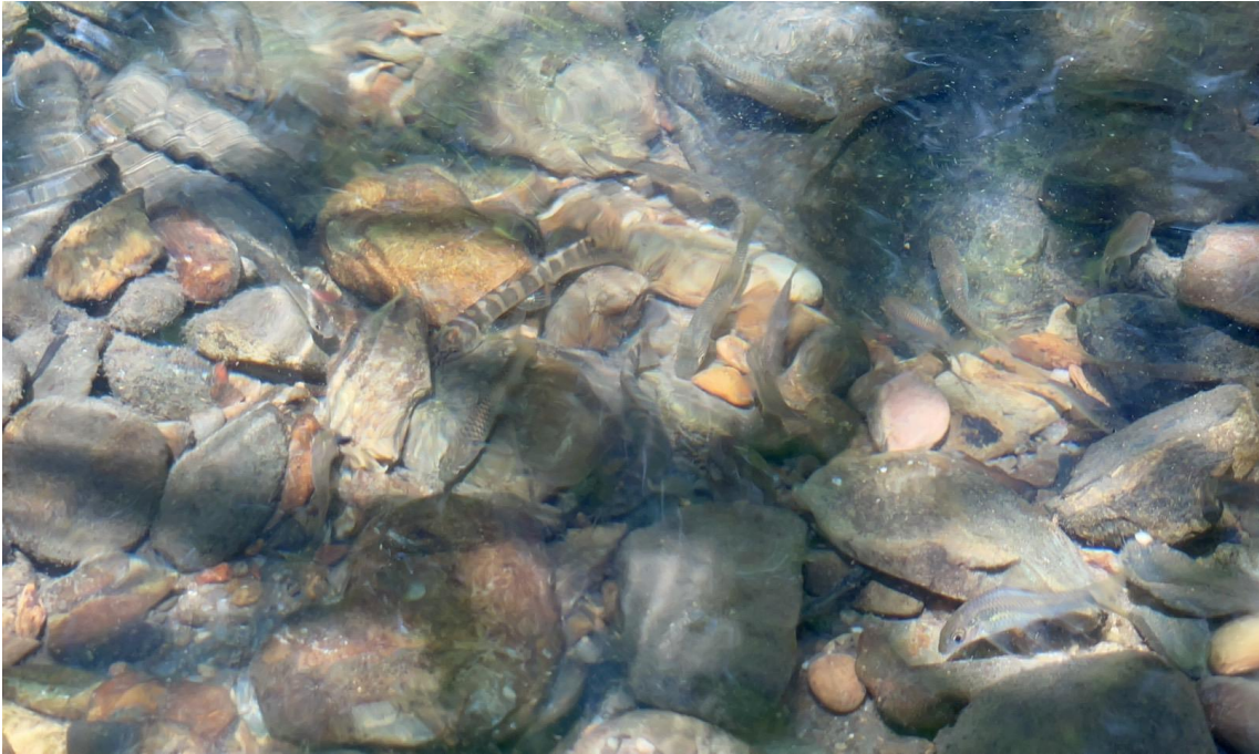
ปลาค้อเกาะช้าง Schistura kohchangensis อยู่ในวงศ์ปลาค้อ (Balitoridae)

โครงการสำรวจทรัพยากรปลาท้องถิ่นตำบลฉนวน อำเภอมะขาม จังหวัดจันทบุรี ดำเนินการสำรวจบริเวณแหล่งน้ำในจุดเก็บตัวอย่างที่อยู่ในเขตรักษาพันธุ์สัตว์ป่าเขาสอยดาว และเขตหน่วยพิทักษ์อุทยานแห่งชาติเขาคิชฌกูฏ โดยใช้การถ่ายภาพตัวอย่างที่สำรวจ เนื่องจากอยู่ในเขตห้ามจับสัตว์น้ำ จากการสำรวจพบปลาจำนวน 5 ชนิด 3 วงศ์ ดังนี้