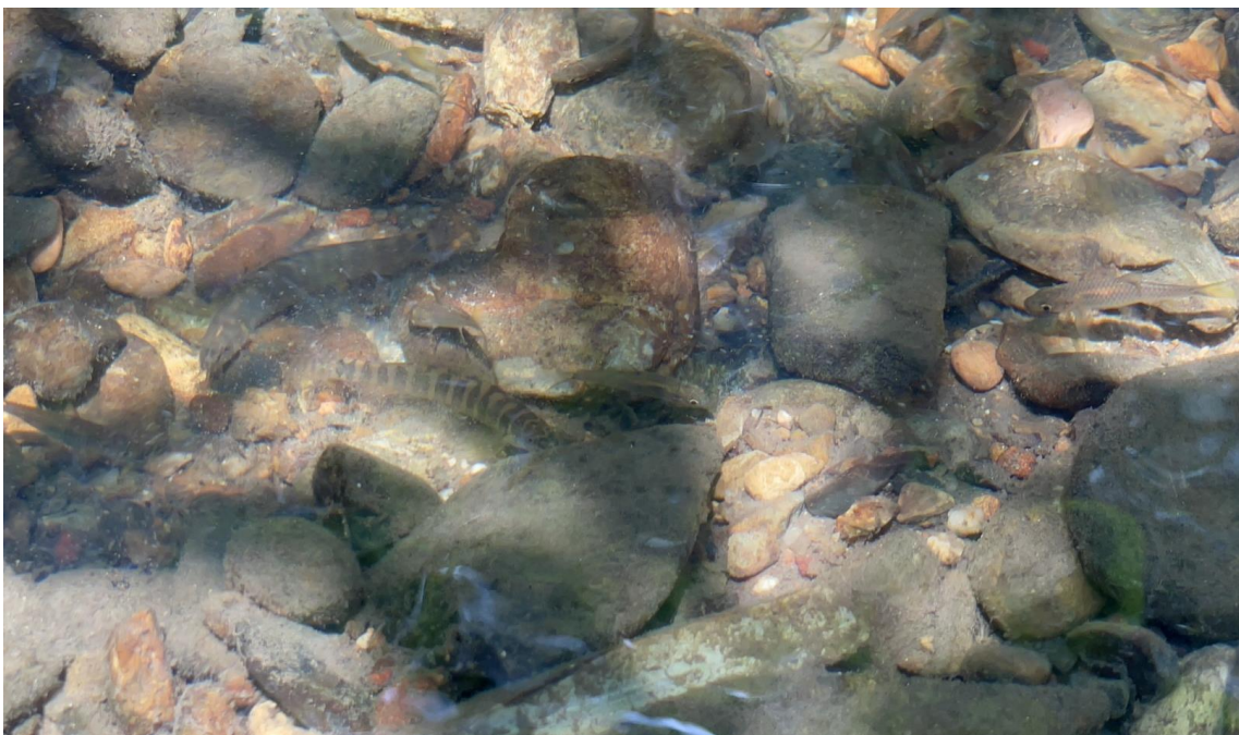
ปลาค้อเกาะช้าง Schistura kohchangensis อยู่ในวงศ์ปลาค้อ (Balitoridae)