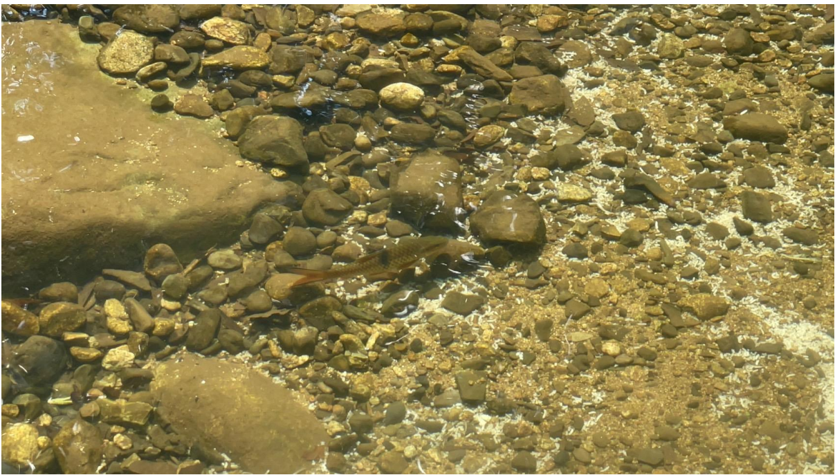
ปลากระสุนขีด Hampala macrolepidota อยู่ในวงศ์ปลาตะเพียน (Cyprinidae)