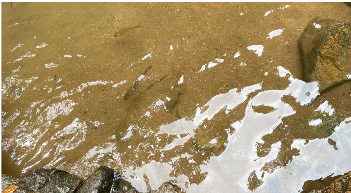
ปลาตะเพียนน้ำตก Puntius aurotaeniatus อยู่ในวงศ์ปลาตะเพียน (Cyprinidae)