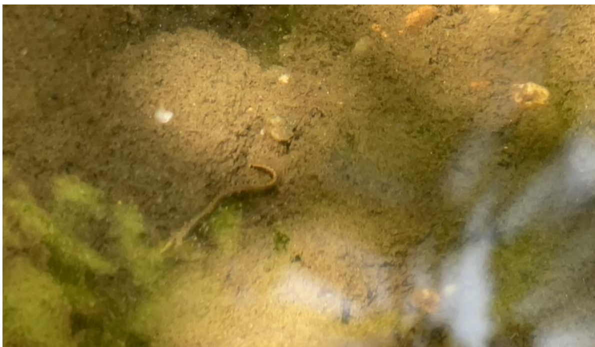
ปลากระทิง Mastacembelus armatus อยู่ในวงศ์ปลากระทิง (Mastacembelidae)