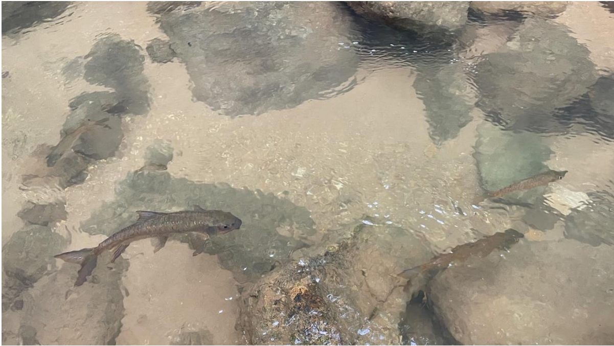
ปลาพลวงหิน Neolissochilus stracheyi อยู่ในวงศ์ปลาตะเพียน (Cyprinidae)